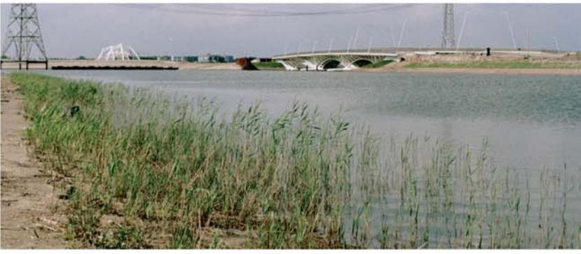
Mai 2002 : Début de la repousse des roseaux