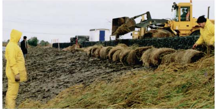
Octobre – Novembre 2001 : Installation des géonattes coco de phragmites