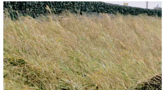
Octobre 2001 : Dès la pose des phragmites, celles-ci ont déjà un système racinaire bien développé. Les rhizomes se sont développés pendant 6 à 7 mois dans nos aqua-pépinières.