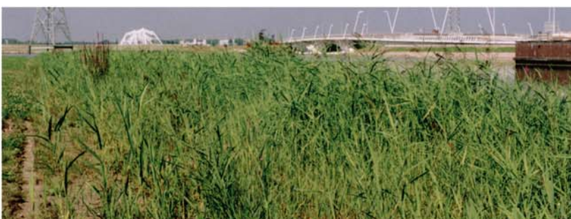
Septembre 2002 : Etat de la roselière une saison après l'installation des phragmites. A certains endroits la végétation est déjà très dense.