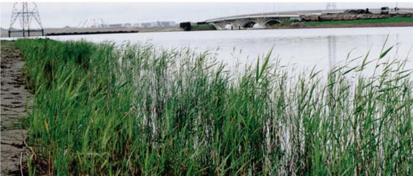
Juin 2002 : Les phragmites se développent rapidement